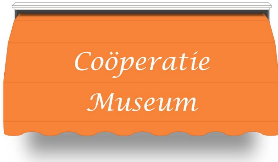
Het nieuwe zonnescherm aan de Lange Haven.

Om ons pand weer te laten schitteren, worden in 2021 de grote zonneschermen aan de Lange Haven en Appelmarkt vervangen.