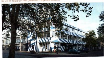
Het Blauw Witte Gebouw, hoofdkwartier van Zoho, (Marlies Lageweg, Plein van Westinghousse Waterfront)

Dit jaar bestaat het museum 45 jaar dus tijd voor een overzichtstentoonstelling. In deze tentoonstelling is o.a. te zien hoe de winkel in de Kethelstraat er uit zag, de oprichtingsstukken, verslagen, nieuwe aanwinsten en spullen die we ontwikkeld hebben voor het bezoek van (school)groepen.